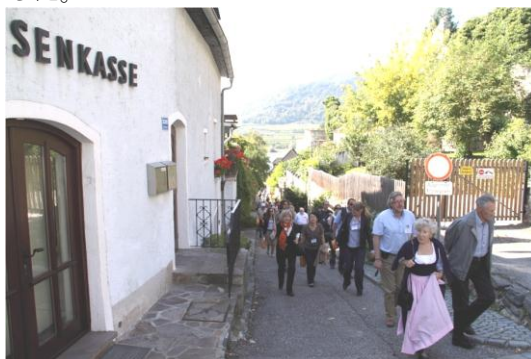
エクスカーションの一風景

学会は受付日も含めて 5 日間ありましたが、あっという間に終わってしまいました。博士 3 年の秋で、私にとっては大変な時期でしたが、学生最後のいい思い出となりました。