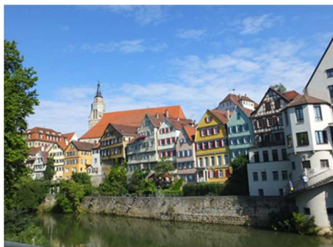
チュービンゲンの街並み

おり、国際色豊かです。マックスプランク研究所は潤沢な資金と、研究に対するサポートが充実しており、研究者が研究に集中することができる環境が整っているため、留学先としてはおすすめです。またヨーロッパの中心に位置するチュービンゲンは様々な国に旅をするのにも便利なので、休暇を見つけてはドイツ国内だけでなく、フランスやイギリス、イタリアなどを旅することもできました。