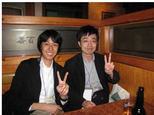
懇親会での様子 筆者（左）と九州沖縄農研の上杉氏

た考えで意気揚々と乗り込んできたのが、いきなり出鼻を挫かれたような形になり、悔しさを覚えました。しかし、所々聞き取れる単語や文をつなげて内容を推測すると、線虫病害の診断や防除、線虫との関わり方など非常に面白い内容が多く、また日本でも韓国でも線虫に対して力を入れている様子が伺えました。